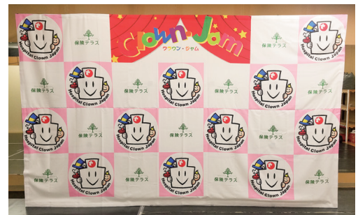
▲「笑顔の未来キャンペーン」で寄贈したバックパネル

弊社では今後も小児病院で病氣と闘う子ども達に笑顔を届けられるよう、日本ホスピタル・クラウン協会の支援を続けてまいります。